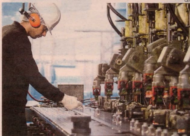
Empleo. En manufactura se alcanzaron 53,000 ingresos de trabajadores a empresas formales privadas entre junio y julio.

En tanto, los ingresos a 53,329 empresas (que al menos contrataron a un trabajador) se sustentaron sobre todo por contratos intermiten-