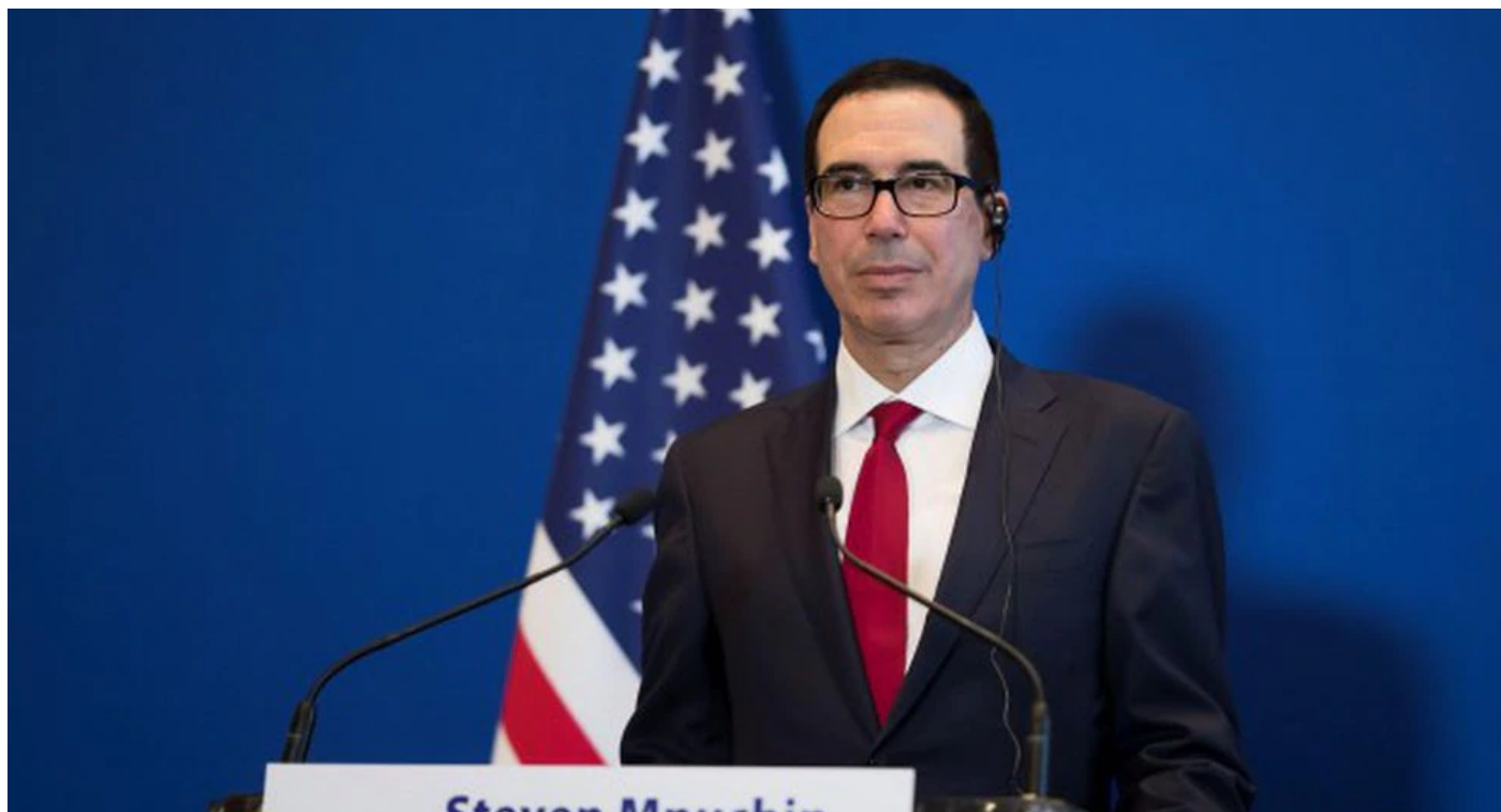
Secretario del Tesoro, Steven Mnuchin.

“Podríamos lograr la segunda fase y remover algunos aranceles. Podemos hacerlo mientras vayamos avanzando”, dijo Steven Mnuchin.