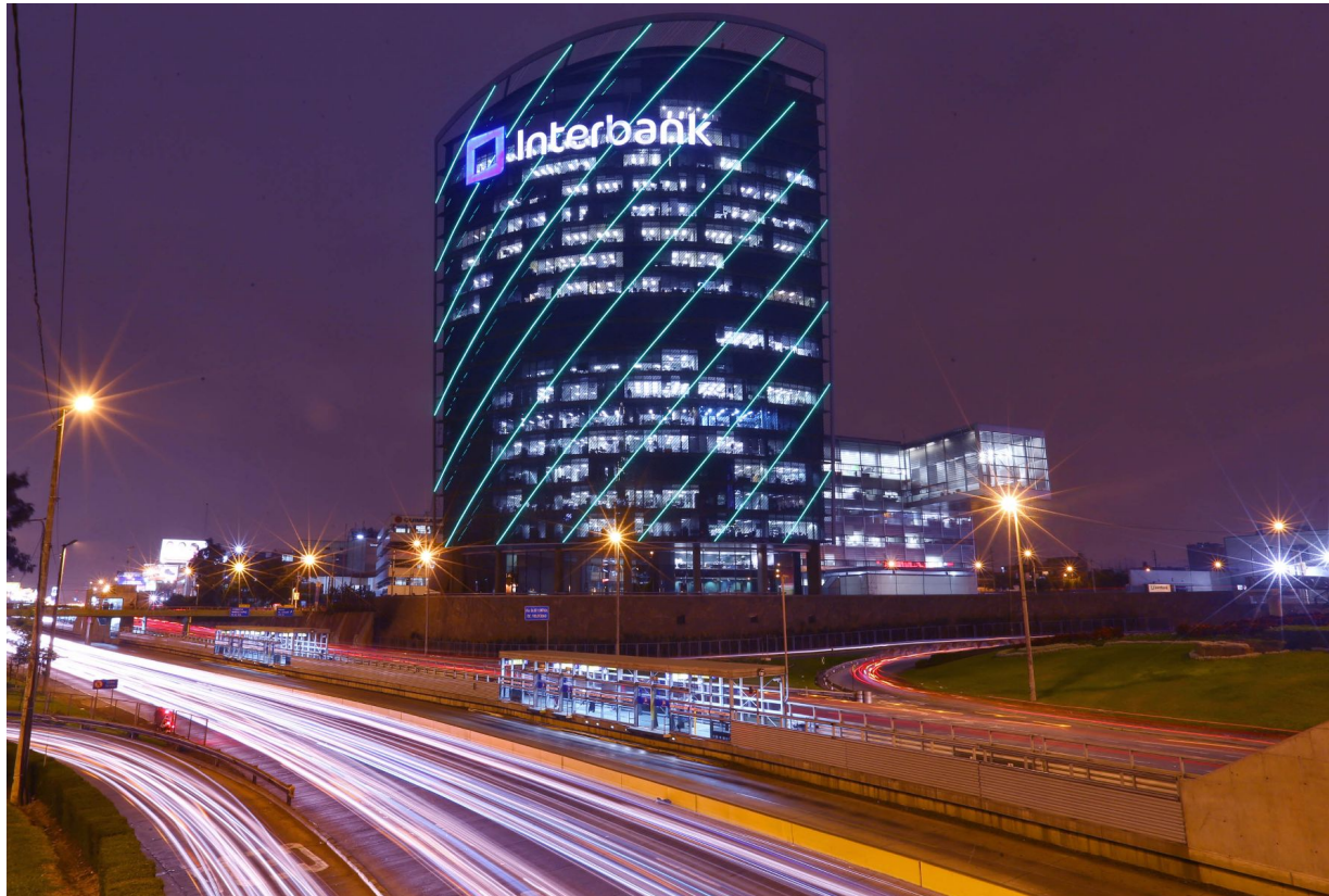
Centro financiero de Lima.